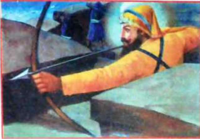
Guru Gobind Singh Ji flinging arrows upon arrows on the Mughal forces

fortress in large numbers followed by gun fire. The fierce battle went on for over two hours. Swords and shields clanged against each other. Arrows were flying all over. Hundreds of Moghul soldiers lay dead on the battlefield. Blood streams were flowing and had covered the entire ground outside the fortress.