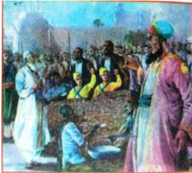
Sahibzadas being bricked alive

upon them but they were both unflinching in their determination and told the executioners, "Raise the wall fast and bury the Moghul Raj quickly. Don't delay for a minute." Thereafter both of them started reciting Japji while the wall was going up brick by brick. The wall went up higher and higher until it reached their chests. The Nawab and Qazi approached them and said to them in an affectionate tone, "There is still time for you to save your lives, just recite the Kalma and the wall will be pulled down immediately."