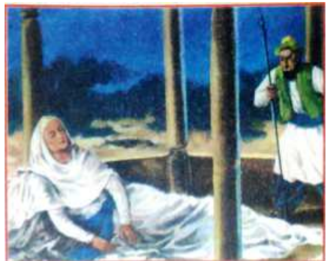
Mata Gujri Ji breathes her last

Mata Gujri Ji breathes her last - As soon as the two Sahibzadas attained martyrdom,