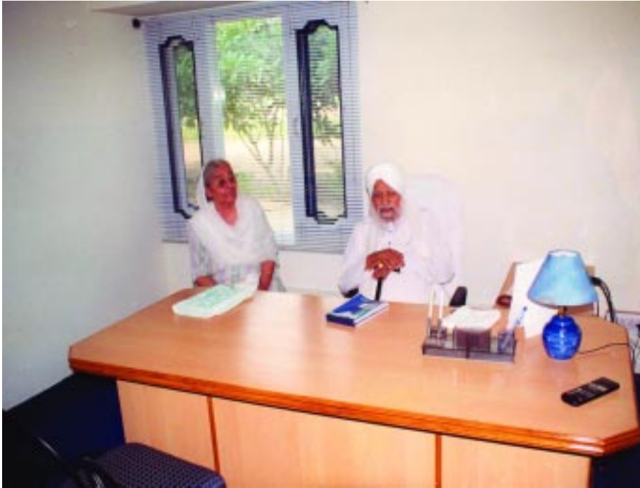
ਪਰਮ ਸਤਿਕਾਰਯੋਗ ਬੀਜੀ ਅਤੇ ਸੰਤ ਮਹਾਰਾਜ ਜੀ ਰਤਵਾੜਾ ਸਾਹਿਬ ਵਿਖੇ ਆਈ.ਟੀ. ਕਾਲਜ ਵਿਖੇ

ਤਾਂ ਮੈਨੂੰ ਕਾਇਬਰੀ ਦੇ ਬਾਣੇਦਾਰ ਨੇ ਦੱਸਿਆ ਕਿ ਸਾਹਿਬ! ਅਸੀਂ ਰਿਪੋਰਟਾਂ ਤਾਂ ਲੈ ਲਈਆਂ, ਪਰ ਤੁਹਾਡੇ ਤੋਂ ਅਸੀਂ ਅਸਲੀ ਗੱਲ ਨਹੀਂ ਛੁਪਾਉਣਾ ਚਾਹੁੰਦੇ। ਕਹਿੰਦੇ ਇਥੇ ਇਕ ਸਰਦਾਰ ਆਇਆ ਹੈ, ਉਹ ਖੇਤੀ ਵੀ ਸਾਰਿਆਂ ਨਾਲੋਂ ਚੰਗੀ ਕਰਦਾ ਹੈ, ਪਰ ਉਹ ਘਰ-ਘਰ ਫਿਰਦਾ ਹੈ, ਕੁਛ ਗਾਉਂਦਾ ਹੈ, ਬੇਅੰਤ ਲੋਕ ਇਕੱਠੇ ਹੁੰਦੇ ਨੇ ਉਹਦੇ ਪਿਛੇ, ਸਮਝ ਲਓ ਇਲਾਕਾ ਹੀ ਲਗ ਗਿਆ। ਉਹਨੇ ਜਿਹੜੇ ਸ਼ਰਾਬਾਂ ਦੇ ਕੇਸ ਸੀ, ਡਰੱਗ ਭਰ ਕੇ ਸ਼ਰਾਬ ਕੱਢਦੇ ਸੀ ਉਹ ਵੀ ਹਟਾ ਦਿਤੇ। ਕਤਲ ਕਰਨੇ ਹਟਾ ਹੀ ਨਹੀਂ ਦਿਤੇ ਸਗੋਂ ਜਿਹੜੇ ਕਤਲ ਕੀਤੇ ਹੋਏ ਸੀ ਉਨ੍ਹਾਂ ਦੇ ਪੰਚਾਇਤੀ ਫੈਸਲੇ ਕਰਾ ਦਿਤੇ। ਉਹਦੇ ਨਾਲ ਹੋਰ ਜੁਰਮ ਡੰਗਰ ਚੋਰੀ ਵਗੈਰਾ ਦੇ ਸੀ, ਉਸ ਤੋਂ ਹਟਾ ਕੇ ਇਨ੍ਹਾਂ ਨੂੰ ਖੇਤੀ ਕਰਨ ਲਾ ਦਿਤਾ। ਸੋ ਅਸੀਂ ਤਾਂ ਹੁਣ ਵਿਹਲੇ ਬੈਠੇ ਹਾਂ ਪੁਲਿਸ ਵਾਲੇ ਤੇ ਕਰੈਡਿਟ ਉਹਨੂੰ ਜਾਣਾ ਚਾਹੀਦਾ ਹੈ। ਸੋ ਕਹਿਣ ਲੱਗਿਆ ਕਿ ਮੈਂ