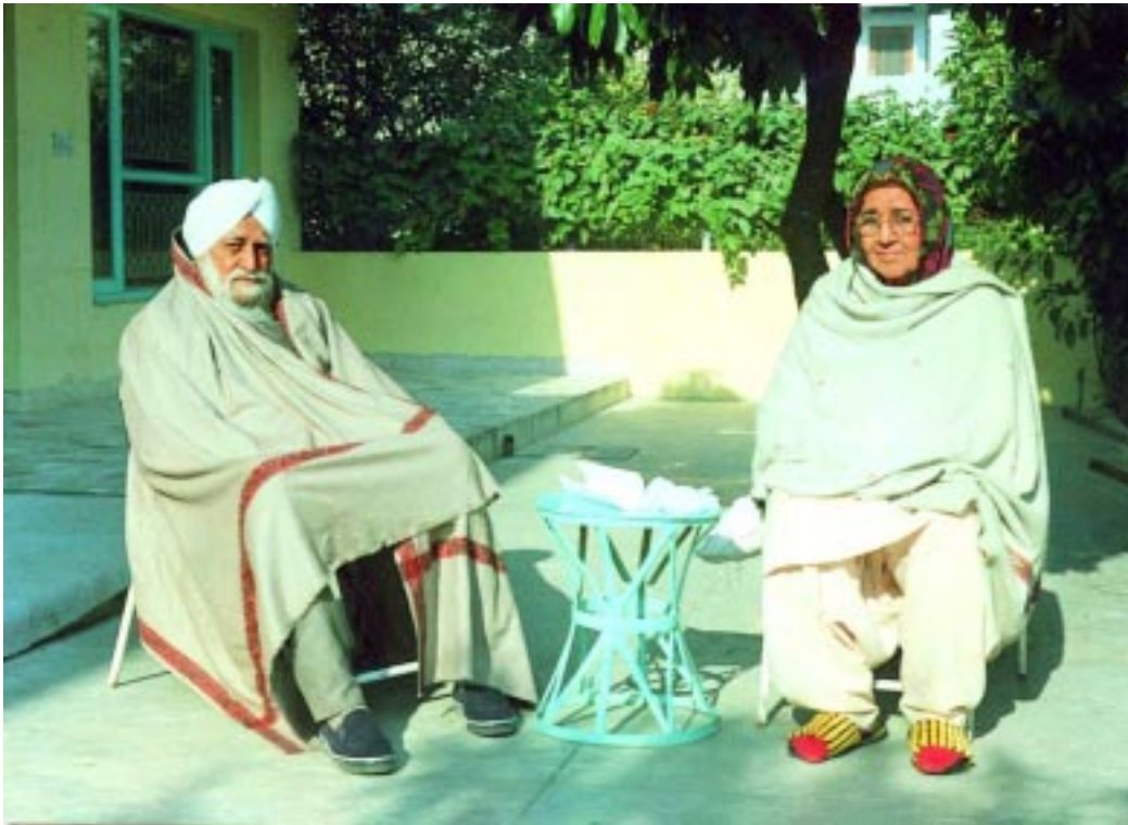
ਸੰਤ ਮਹਾਰਾਜ ਰਤਵਾੜਾ ਸਾਹਿਬ ਅਤੇ ਪਰਮ ਪੂਜਯ ਸਤਿਕਾਰਯੋਗ ਬੀਜੀ ਜੀ ਨਿਵਾਸ ਅਸਥਾਨ ਮੋਹਾਲੀ ਵਿਖੇ

ਜੇ ਕਹਿੰਦਾ ਕਿ ਮੈਂ ਤਾਂ ਨਹੀਂ ਪੀਂਦਾ, ਐਹੋ ਜਿਹਾ ਖਿਆਲ ਉਹਦਾ ਵੀ ਨਹੀਂ ਸੀ, ਉਹਨੂੰ ਪਤਾ ਸੀ ਕਿ ਇਹ ਤਾਂ ਨਹੀਂ ਕਰਦਾ। ਪਰ ਇਹਦੇ ਜਿਹੜੇ ਦੇਸ਼ ਦੇ ਵਾਸੀ ਨੇ ਉਹ ਕਰਦੇ ਨੇ। ਇਸ ਗੱਲ ਲਈ ਮੈਂ ਜਿਹੜੇ ਵੱਡੇ-ਵੱਡੇ ਫਾਰਮਰ ਸੀ, ਹਜ਼ਾਰ-ਹਜ਼ਾਰ ਏਕੜਾਂ ਦੇ ਮਾਲਕ, ਸਾਰੇ ਇਕੱਠੇ ਕਰੇ ਕਿ ਆਹ ਗੱਲ ਹੈ ਆਪਣੀ ਬਦਨਾਮੀ ਐਨੀ ਹੋ ਚੁੱਕੀ ਹੈ। ਸਾਨੂੰ ਪਸ਼ੂ ਚੋਰ ਕਹਿੰਦੇ ਨੇ। ਸੋ ਇਹਦਾ ਕੋਈ ਇਲਾਜ ਕਰੋ। ਉਨ੍ਹਾਂ ਨੂੰ ਤਾਂ ਕੋਈ ਵਿਹਲ ਨਹੀਂ ਸੀ। ਮੈਂ ਆਪਣਾ ਕੰਮ ਕਰਦਾ ਹੋਇਆ, ਜਦੋਂ ਮੈਂ ਦੇਖਿਆ ਕਿ ਇਹ ਵੱਡੇ ਆਦਮੀ ਕੁਛ ਨਹੀਂ ਕਰਦੇ,