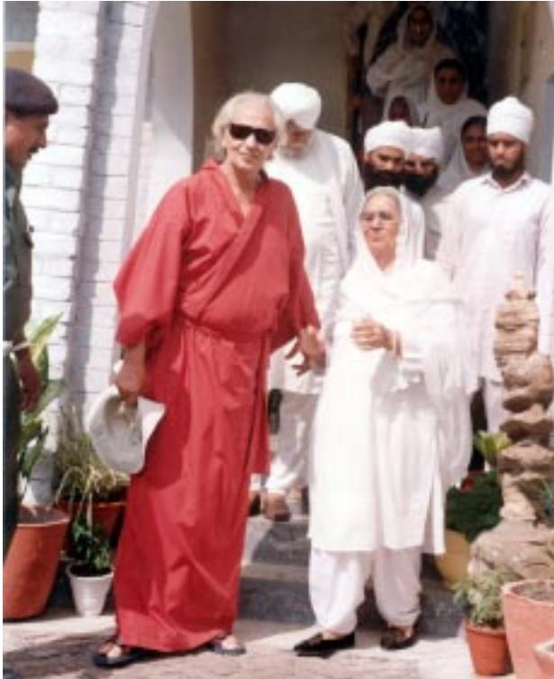
ਅਭੁੱਲ ਯਾਦ ਸੰਤ ਮਾਤਾ ਬੀਜੀ ਜੀ ਦੇਹਰਾਦੂਨ ਜੋਲੀਗਰਾਂਟ ਵਿਖੇ ਡਾ. ਸਵਾਮੀ ਰਾਮ ਜੀ ਨਾਲ ਜਿਨ੍ਹਾਂ ਨੇ ਬੀਜੀ ਨੂੰ ਪਛਾਣ ਕੇ ਆਪਣੇ ਪਿਛਲੇ ਜਨਮ ਦੀ ਮਾਂ ਦੱਸਿਆ।

ਦੱਸੀ ਜੁਗਤ ਅਨੁਸਾਰ ਕੋਸੇਟ ਲਗਾ ਕੇ ਸਵਾਸ ਰਾਹੀਂ ਸਿਮਰਨ ਕਰਵਾਇਆ ਜਾਂਦਾ ਹੈ। 4.00 ਤੋਂ 6.00 ਵਜੇ ਤੱਕ ਆਸਾ ਜੀ ਦੀ ਵਾਰ ਦੇ ਕੀਰਤਨ, 7.00 ਵਜੇ ਧੰਨ ਧੰਨ ਸਾਹਿਬ ਸ੍ਰੀ ਗੁਰੂ ਗ੍ਰੰਥ ਸਾਹਿਬ ਜੀ ਕਥਾ, ਉਪਰੰਤ 8.00 ਵਜੇ ਤੋਂ ਸੰਤ ਸਮਾਗਮ ਸ਼ੁਰੂ ਹੋ ਜਾਂਦਾ ਹੈ। ਜਿਸ ਵਿਚ ਵੱਖ ਵੱਖ ਸੰਪ੍ਰਦਾਇ ਦੇ ਸਾਧੂ ਸੰਤ ਮਹਾਤਮਾ ਆਪਣੇ ਅਨੁਭਵੀ ਕੀਰਤਨ ਪ੍ਰਵਚਨਾਂ ਰਾਹੀਂ ਸੰਗਤਾਂ ਨੂੰ ਨਿਹਾਲ ਕਰਦੇ ਹਨ। ਸ਼ਾਮ 4.00 ਵਜੇ ਦਿਨ ਦੇ ਦਿਵਾਨ ਦੀ ਸਮਾਪਤੀ ਦੀ ਅਰਦਾਸ ਉਪਰੰਤ 5.00 ਵਜੇ ਰਹਿਰਾਸ, ਸ੍ਰੀ ਸੂਰਜ ਪ੍ਰਕਾਸ਼ ਗ੍ਰੰਥ ਦੀ ਕਥਾ, ਮਹਾਂਪੁਰਖਾਂ ਦੇ ਵੀਡੀਓ ਕੈਸੇਟ ਰਾਹੀਂ ਪ੍ਰਵਚਨ ਉਪਰੰਤ ਉਦਾਸੀ ਸੰਪ੍ਰਦਾਇ ਆਨ ਮੱਤਾਂ ਦੇ ਸਾਧੂ ਸੰਤ ਸੂਫੀ, ਢਾਡੀ ਸੰਗਤਾਂ ਨੂੰ ਨਿਹਾਲ ਕਰਦੇ ਹਨ ਅਤੇ 11.00 ਵਜੇ ਸਮਾਪਤੀ ਦੀ ਅਰਦਾਸ ਕੀਤੀ ਜਾਂਦੀ ਹੈ। ਇਹ ਸਮਾਗਮ 1000X240 ਦੇ ਵੱਡੇ ਪੰਡਾਲ ਵਿੱਚ ਮਨਾਇਆ ਜਾਂਦਾ ਹੈ। ਸਮਾਗਮ ਦੁਰਾਨ 24 ਘੰਟੇ ਗੁਰੂ ਕੇ ਲੰਗਰ ਅਤੁੱਟ ਵਰਤਦੇ ਰਹਿੰਦੇ ਹਨ। ਅੱਖਾਂ ਦਾ ਫਰੀ ਮੈਡੀਕਲ ਕੈਂਪ ਲਗਾਇਆ ਜਾਣਾ ਹੈ ਜਿਸ ਵਿੱਚ ਲੋੜ ਵੰਦ ਪ੍ਰੇਮੀਆਂ ਨੂੰ ਲੈਨਸ, ਐਨਕਾਂ ਅਤੇ ਅੱਖਾਂ ਦੇ ਫਰੀ ਓਪਰੇਸ਼ਨ ਕੀਤੇ ਜਾਣੇ ਹਨ। ਇਸੇ ਤਰਾਂ ਦੇਹਰਾਦੂਨ ਜੋਲੀ ਗਰਾਂਟ ਤੋਂ ਡਾ. ਸਵਾਮੀ ਰਾਮ ਜੀ ਦੇ ਰਾਸਪਿਟਲ ਤੋਂ ਡਾਕਟਰਾਂ ਦੀ ਟੀਮ ਨੇ ਅਉਣਾ ਹੈ ਜੋ ਕਿ ਲੱਖਾਂ ਰੁਪਏ ਦੀਆਂ ਫਰੀ ਦਵਾਈਆਂ ਸੰਗਤਾਂ ਨੂੰ ਚੈਕਅਪ ਕਰਕੇ ਦਵਾਈਆਂ ਹਿਰਦਿਆਂ ਵਿਚ ਫੈਲਾਉਣਾ, ਇਹ ਸਾਡਾ ਆਦਰਸ਼ ਹੈ। ਜਦੋਂ ੧੯੯੩ ਦੇਣਗੇ।) ਇਹ ਇਕ ਉਤਸਾਹ ਸੀ ਜੋ ਉਨ੍ਹਾਂ ਸੰਗਤਾਂ ਵਿੱਚ ਪੈਦਾ ਹੋਇਆ ਜਿਹੜੇ 1986 ਤੋਂ ਪਹਿਲਾਂ ਤਮਾਕੂ ਬੀਜਦੇ ਸਨ, ਜਰਦੇ ਵਿਚ ਤਮਾਕੂ ਖਾਂਦੇ ਸਨ, ਸ਼ਰਾਬ ਪੀਂਦੇ ਸਨ ਅਤੇ ਸੱਪਾਂ, ਭੂਤਾਂ-ਪ੍ਰੇਤਾਂ, ਦਰੱਖਤਾਂ ਨੂੰ ਮੱਥੇ ਟੇਕਦੇ ਸਨ; ਤਾਂਤਰੀ ਲੋਕ ਇਨ੍ਹਾਂ ਨੂੰ ਖੂਬ ਲੁੱਟ ਰਹੇ ਸਨ ਪਰ ਜਦੋਂ ਗੁਰਮਤਿ ਦਾ ਪ੍ਰਕਾਸ਼ ਹੋਇਆ, ਉਸ ਸਮੇਂ ਇਹ ਪਖੰਡਾਂ ਦੀ ਖੋਲ੍ਹ ਕਰਨ ਵਾਲੇ ਲੋਕ ਆਪਣੇ ਆਪ ਹੀ ਰੋਪੜ, ਬਨੂੰੜ, ਰਾਜਪੁਰਾ, ਅੰਬਾਲਾ, ਪਟਿਆਲਾ ਅਤੇ ਫਤਹਿਗੜ੍ਹ ਦੇ ਇਲਾਕੇ ਵਿਚੋਂ ਅਲੋਪ ਹੋ ਗਏ ਅਤੇ ਇਹ ਸੁਚੱਜਾ ਤੇ ਸਚਿਆਰ ਜੀਵਨ ਦ੍ਰਿਸ਼ਟੀ ਗੋਚਰੇ ਹੋਣ ਲੱਗਿਆ। ਨਸ਼ੇ