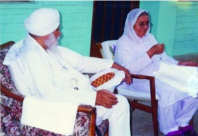
ਅਭੁੱਲ ਯਾਦ "ਸੰਤ ਮਹਾਰਾਜ ਰਤਵਾੜਾ ਸਾਹਿਬ ਵਾਲੇ ਅਤੇ ਪਰਮ ਸਤਿਕਾਰਯੋਗ ਬੀਜੀ ਰਤਵਾੜਾ ਸਾਹਿਬ ਵਿਖੇ

ਛੱਡਣ ਨਾਲ ਜਨਤਾ ਦੀ ਸਿਹਤ ਉੱਤੇ ਬਹੁਤ ਚੰਗਾ ਅਸਰ ਪਿਆ। ਪ੍ਰਸਪਰ ਮਿਲਵਰਤਣ ਦਾ ਭਾਵ, ਸੇਵਾ ਕਰਨ ਦੀ ਲਾਲਸਾ ਨਾਲ ਇਕ ਬੜਾ ਨਿਰੋਇਆ ਭਾਈਚਾਰਾ ਹੋਂਦ ਵਿੱਚ ਆਇਆ। ਇਲਾਕੇ ਦੇ ਲੋਕਾਂ ਦੀ ਆਰਥਿਕ ਹਾਲਤ ਨਸ਼ੇ ਛੱਡਣ ਨਾਲ ਪਲਟਾ ਖਾ ਗਈ, ਬਹੁਤ ਸੋਫੀ ਖੇਤੀ ਅਤੇ Dairy farming ਹੋਣ ਲੱਗੀ। ਬੱਚੇ ਪੜ੍ਹਾਈ-ਲਿਖਾਈ ਵਿੱਚ ਆਪਣਾ ਤਾਣ ਲਾਉਣ ਲਗੇ ਅਤੇ ਇਹੀ ਇਲਾਕੇ ਜਿਨ੍ਹਾਂ ਨੂੰ backward ਸਮਝ ਕੇ ਕੋਈ ਪ੍ਰਚਾਰਕ ਇਨ੍ਹਾਂ ਥਾਵਾਂ ਤੇ ਆਇਆ ਨਹੀਂ ਸੀ ਕਰਦਾ; ਅੱਜ ਇਹ ਅਗਾਂਹ-ਵਧੂ ਹੋਣ ਦੇ ਪ੍ਰਤੀਕ ਨਜ਼ਰ ਆਉਣ ਲਗੇ ਹਨ। ਪਿੰਡਾਂ-ਪਿੰਡਾਂ ਵਿੱਚ ਆਸਾ ਜੀ ਦੀ ਵਾਰ ਦੇ ਕੀਰਤਨ ਕਰਨ ਵਾਲੇ, ਆਪਣੀਆਂ ਹੋਰ ਧਾਰਮਿਕ ਕ੍ਰਿਆਵਾਂ ਨਿਭਾਉਣ ਵਾਲੇ ਪੈਦਾ ਹੋ ਗਏ ਅਤੇ ਇਕ ਤਰ੍ਹਾਂ ਨਾਲ ਇਨ੍ਹਾਂ ਇਲਾਕਿਆਂ ਵਿਚ ਇਨਕਲਾਬ ਹੀ ਆ ਗਿਆ। ਵਿਸ਼ਵ ਗੁਰਮਤਿ ਰੂਹਾਨੀ ਮਿਸ਼ਨ ਦੇ ਆਦਰਸ਼ਾਂ ਵਿਚ ਕਿਸੇ ਮਜ਼੍ਹਬ, ਸੰਪ੍ਰਦਾ, ਕਿਸੇ ਰਜਸੀ ਪਾਰਟੀ ਨਾਲ, ਨਾ ਹੀ ਹਿੱਤ ਅਤੇ ਨਾ ਹੀ ਅਹਿਤ ਦੀ ਨੀਤੀ ਨੂੰ ਮੁਖ ਰਖ ਕੇ ਉਸ ਮੁਤਾਬਿਕ ਕੰਮ ਹੁੰਦਾ ਰਿਹਾ ਹੈ। ਅਸੀਂ ਸਰਬਤ ਦਾ ਭਲਾ ਚਾਹੁੰਦੇ ਹੋਏ ਅੱਗੇ ਵਧਦੇ ਗਏ ਅਤੇ ਕਿਸੇ ਨਾਲ ਵੀ ਅਸੀਂ confrontation ਵਿੱਚ ਨਾ ਆਏ। ਇਕੋ ਆਤਮਾ ਸਾਰਿਆਂ ਵਿੱਚ ਪ੍ਰੀਪੂਰਨ ਸਮਝ ਕੇ ਇਸ ਦਾ ਪ੍ਰਕਾਸ਼ ਹਨ੍ਹੇਰਿਆਂ ਵਿਚ ਪਟਿਆਲਾ, ਰੋਪੜ, ਫਤਹਿਗੜ੍ਹ ਸਾਹਿਬ ਦੇ ਪਿੰਡ ਹੜ੍ਹਾਂ ਦੀ ਮਾਰ ਵਿੱਚ ਆਏ ਤਾਂ ਉਸ ਸਮੇਂ ਵਿਸ਼ਵ ਗੁਰਮਤਿ ਰੂਹਾਨੀ ਮਿਸ਼ਨ ਦੇ ਮੈਂਬਰਾਂ ਨੇ ਘਰ-ਘਰ ਵਿੱਚ ਜਾ ਕੇ ਲੋੜੀਂਦੀਆਂ ਵਸਤਾਂ, ਵਸਤਰ ਅਤੇ ਹੋਰ ਅਨੇਕਾਂ ਚੀਜ਼ਾਂ ਨਾਲ ਸਹਾਇਤਾ ਕੀਤੀ। ਸਕੂਲ ਦੇ ਬੱਚਿਆਂ ਨੂੰ ਨਵੇਂ ਸਿਰਿਓ ਪੁਸਤਕਾਂ, ਵਰਦੀਆਂ, ਬੂਟ ਲੈ ਕੇ ਦਿਤੇ, ਸਕੂਲਾਂ ਨੂੰ disinfect ਕਰਾ ਕੇ ਸਫੈਦੀ ਕਰਾਈ, ਗਿਰੇ ਹੋਏ ਮਕਾਨਾਂ ਨੂੰ ਮੁੜ ਉਸਾਰਿਆ। ਇਸ ਮੰਤਵ ਲਈ ਮਿਸ਼ਨ ਵੱਲੋਂ ਉਸ ਸਮੇਂ ੨੦ ਲੱਖ ਰੁਪਏ, ਬਿਨਾਂ ਕਿਸੇ ਤੋਂ ਪ੍ਰਸੰਸਾ ਲਏ, ਲੋੜਵੰਦਾਂ ਲਈ